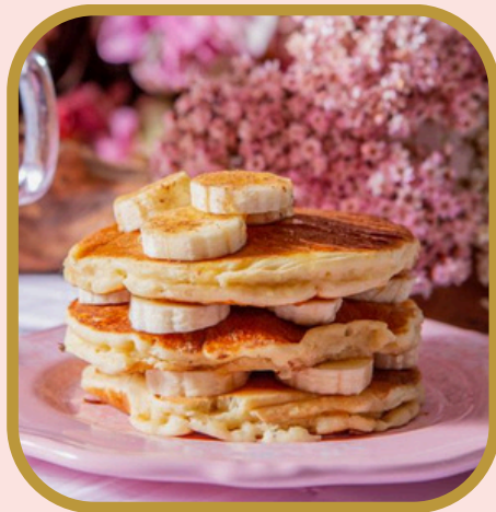
Panqueca de banana e mel