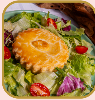
Quiche com salada