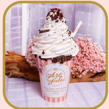
Frapê de ovomaltine