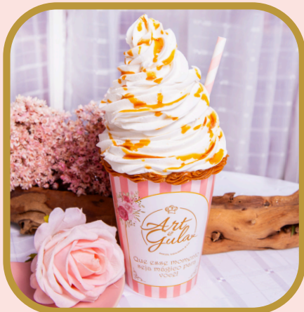
Frapê de doce de leite