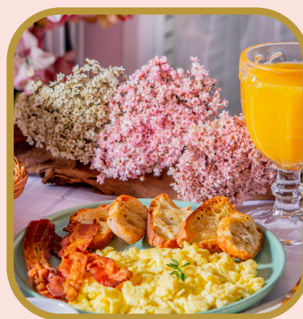
Ovos mexidos com bacon