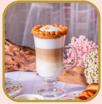
Latte doce de leite