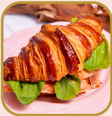
Croissant parma com rúcula

Croissant mil folhas clássico recheado com morango e nutella. R$ 40