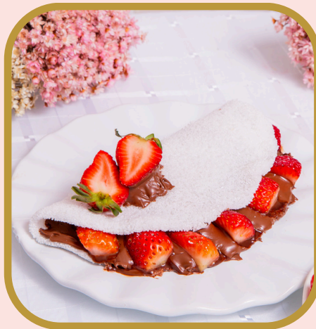
Tapioca de morango com Nutella