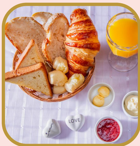
Cesta de pães para duas pessoas