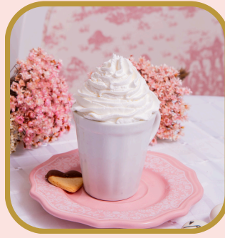
Espresso con panna