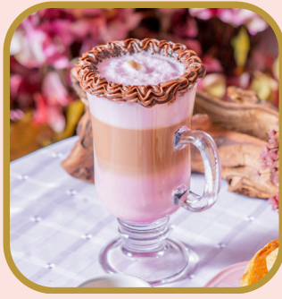
Latte Art Gula