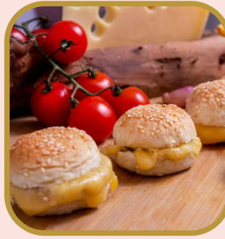
Mini X- Burger