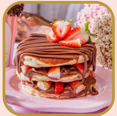
Panqueca de morango com Nutella