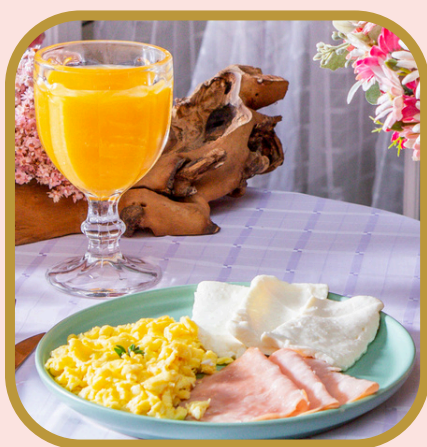
Ovos mexidos com peito de peru e queijo branco

Três ovos mexidos acompanhados com tomate e torradas.