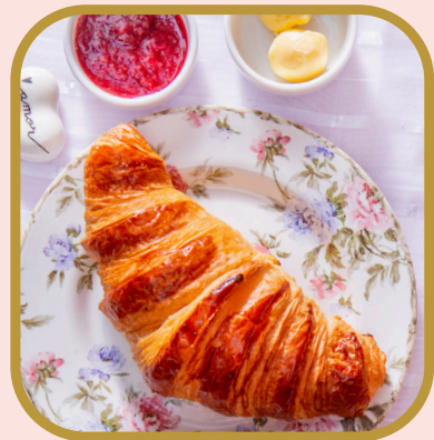
Croissant classic duo