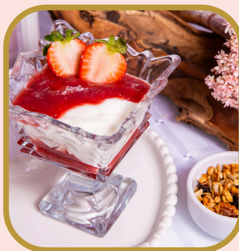
logurte de morango com geleia