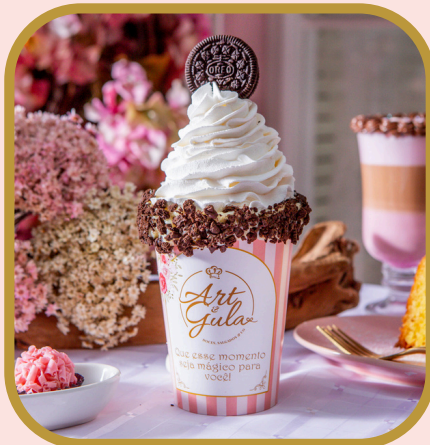
Frapê de oreo