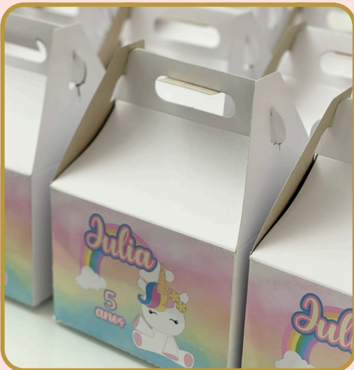
Festa na escolinha