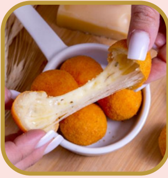
Bolinha de queijo