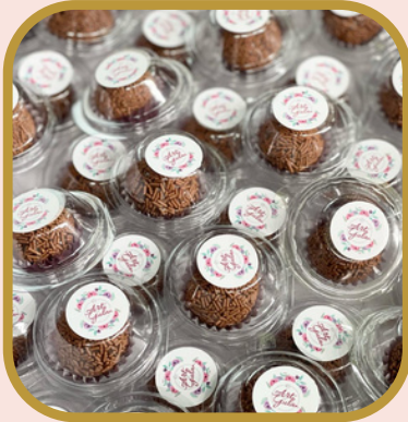
Blister 1 unid