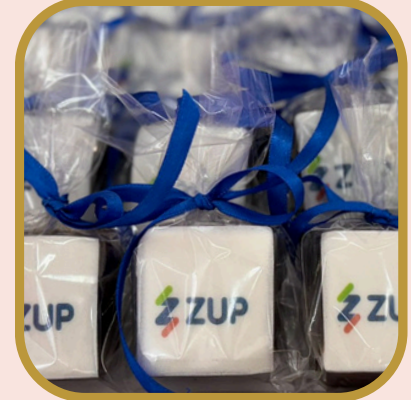
Pão de mel retangular no saquinho