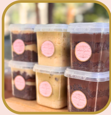
Bolo de pote