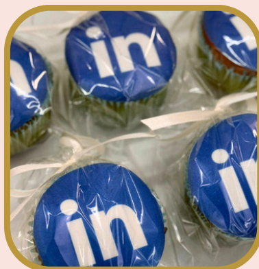
Cupcake no saquinho