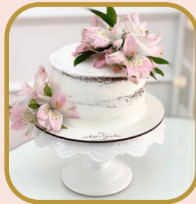
Semi naked + flor adicional natural