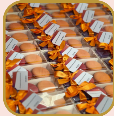
Caixa branca 2 unds