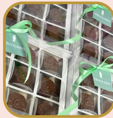
Caixa branca 9 unds