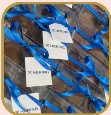
Caixa acetato 3 unds