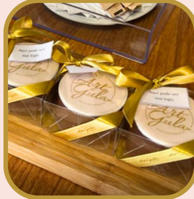
Pão de mel na caixa de acetato