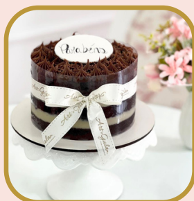
Naked no acetato