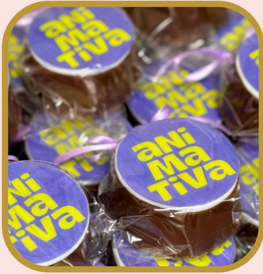
Pão de mel redondo no saquinho