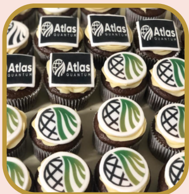
Cupcake sem embalagem