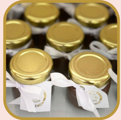
Potinho de brigadeiro de colher 1 und