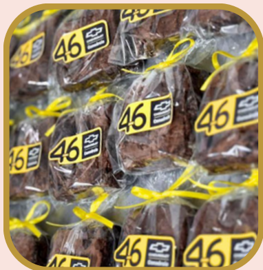
Brownie no saquinho