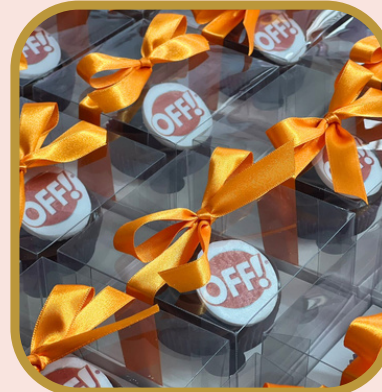
Cupcake na caixa