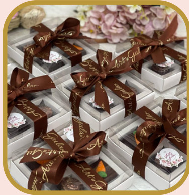
Cx branca 4 unds