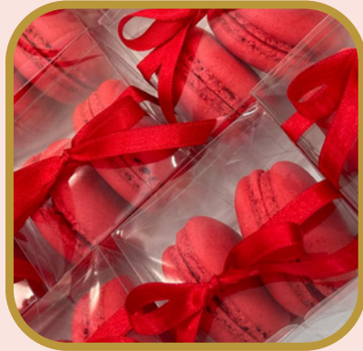
Caixa de acetato 2 unds