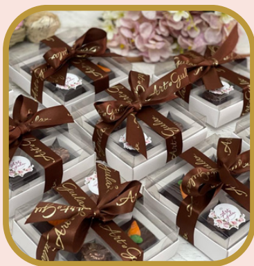
Caixa branca 4 unds