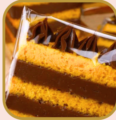
Bolo slice - Peçaço