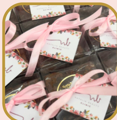
Brownie na caixa acetato